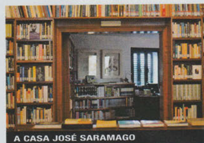
A CASA JOSÉ SARAMAGO

Centro de Interpretación del Aloe Vera Carretera Jameos del Agua 2, Punta Mujeres, tel. 0034-928-848603; www.aloepluslanzarote.com Ingresso libero Centro esposizione con negozio dell'azienda Aloe Plus Lanzarote,