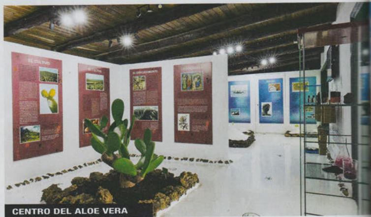
CENTRO DEL ALOE VERA