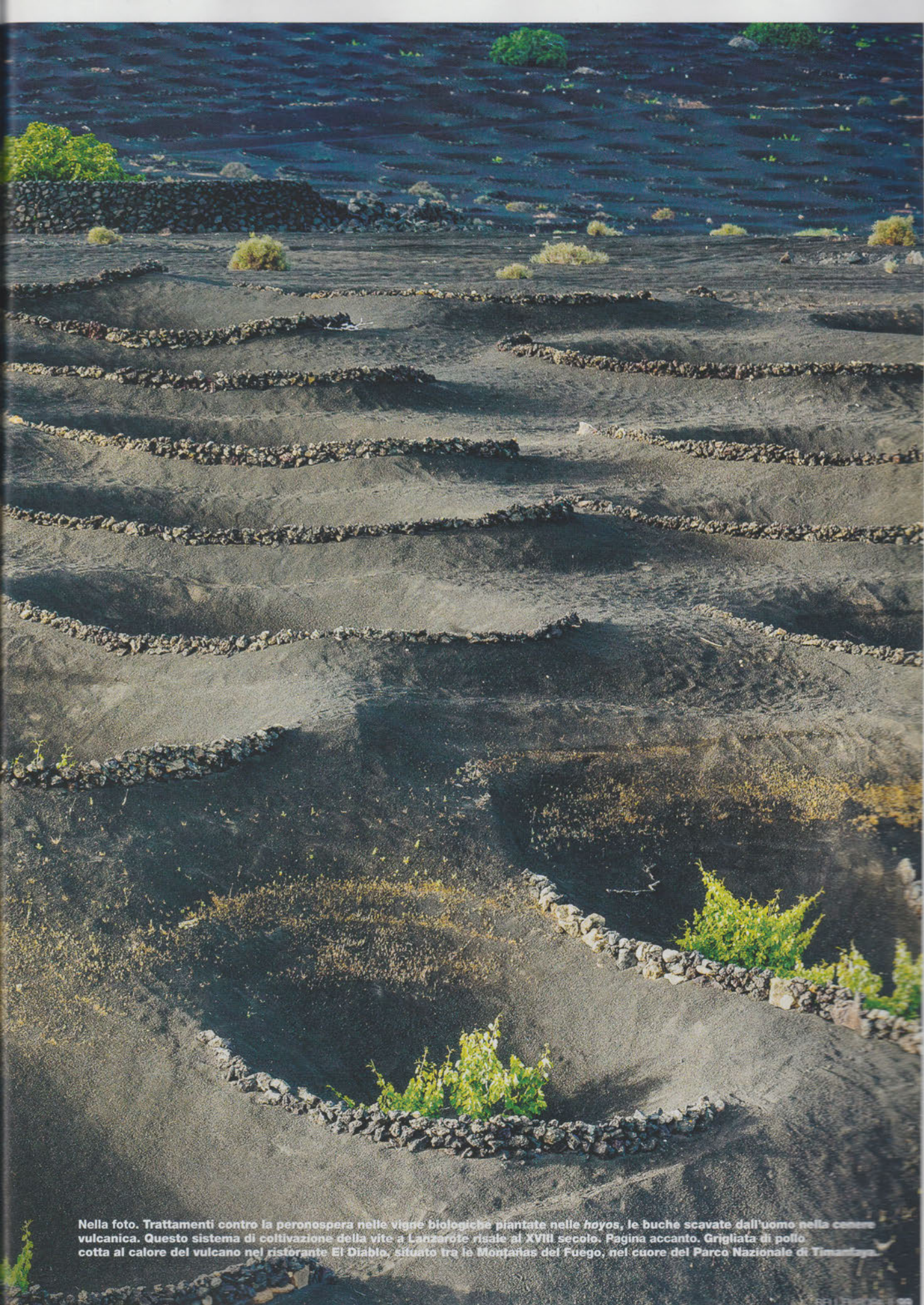
Nella foto. Trattamenti contro la peronospera nelle vigne biologiche piantate nelle hoyos, le buche scavate dall'uomo nella cenere vulcanica. Questo sistema di coltivazione della vite a Lanzarote risale al XVIII secolo. Pagina accanto. Grigliata di pollo cotta al calore del vulcano nel ristorante El Diablo, situato tra le Montañas del Fuego, nel cuore del Parco Nazionale di Timanfaya.