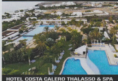
HOTEL COSTA CALERO THALASSO & SPA

di pesce, stufato di capra, pesce alla griglia. Anche tavolini nel centro pedonale accanto alla chiesa di Nuestra Señora de la Encarnación. Conto medio: 19 €.