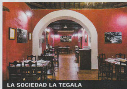
LA SOCIEDAD LA TEGALA

A Lanzarote: Oficina de Turismo, aeroporto, Terminal Arrivi T1, tel. 0034-928-820704; turismolanzarote.com