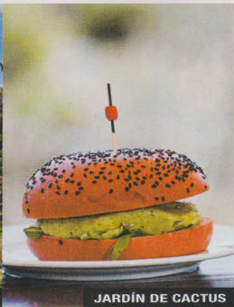
JARDÍN DE CACTUS

e riserva marina, La Graciosa è l'ottava isola dell'arcipelago canario, riconosciuta nel 2018 dopo il successo di una petizione per l'autonomia da Lanzarote. Estesa su 29 kmq, è brulla, semidesertica, priva di strade asfaltate, con soli 658 abitanti, un vulcano spento (il Mojón), una "vetta" (Montaña de Las Agujas, 267 m) e varie spiagge sabbiose: tra le più belle La Concha e la spiaggetta di Caleta del Sebo, la "capitale" (l'unico altro centro abitato è Pedro Barba, un elegante buen retiro). L'isola si gira a piedi, in bici o in jeep, ma solo i residenti sono autorizzati a guidare. Con El Archipiélago Chinijo (calle La Popa angolo Las Sirenas, Caleta del Sebo, tel. 0034-628-418414/443234) noleggiare bici da 10 € al giorno, e-bike 35 €, giro dell'isola in jeep (90 minuti) 70 € per 2 passeggeri. La Graciosa si raggiunge dal porticciolo di Órzola in 25 minuti di traghetto con i battelli di Lineas Romero (tel. 0034-928-596107; www.lineasromero.com): biglietto a/r 26 €.