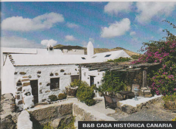
B&B CASA HISTÓRICA CANARIA