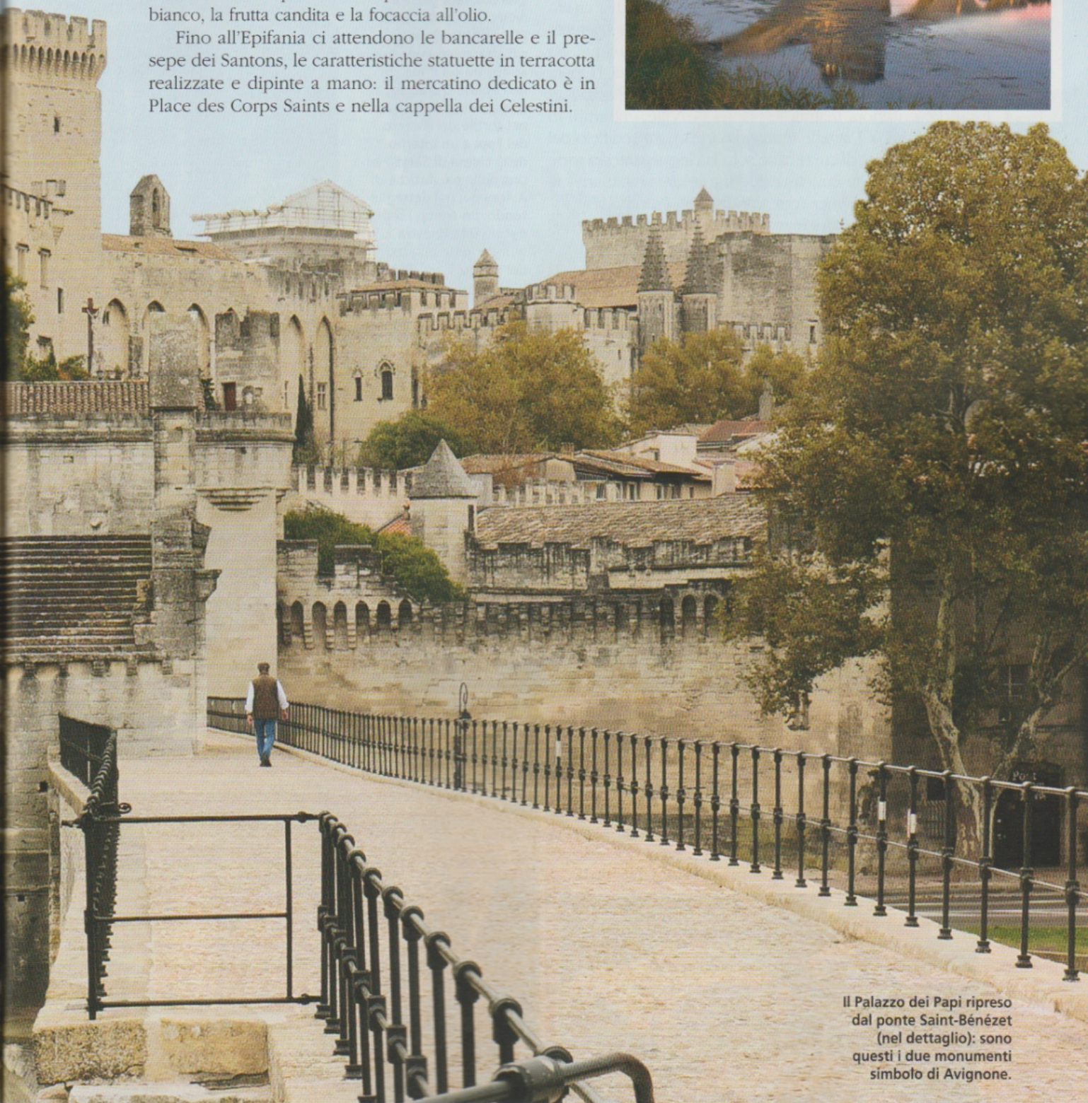
Il Palazzo dei Papi ripreso dal ponte Saint-Bénézet (nel dettaglio): sono questi i due monumenti simbolo di Avignone.